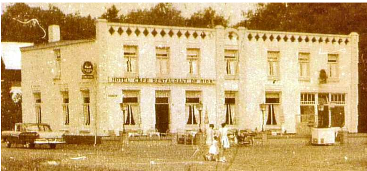
Hier was in 1955 de Ripse telefooncentrale gevestigd