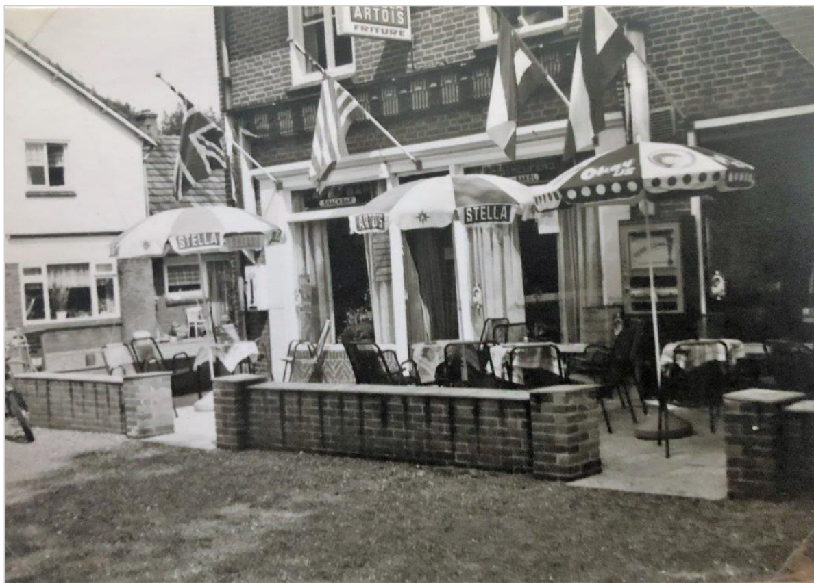
▲ De horecazaak met friture.