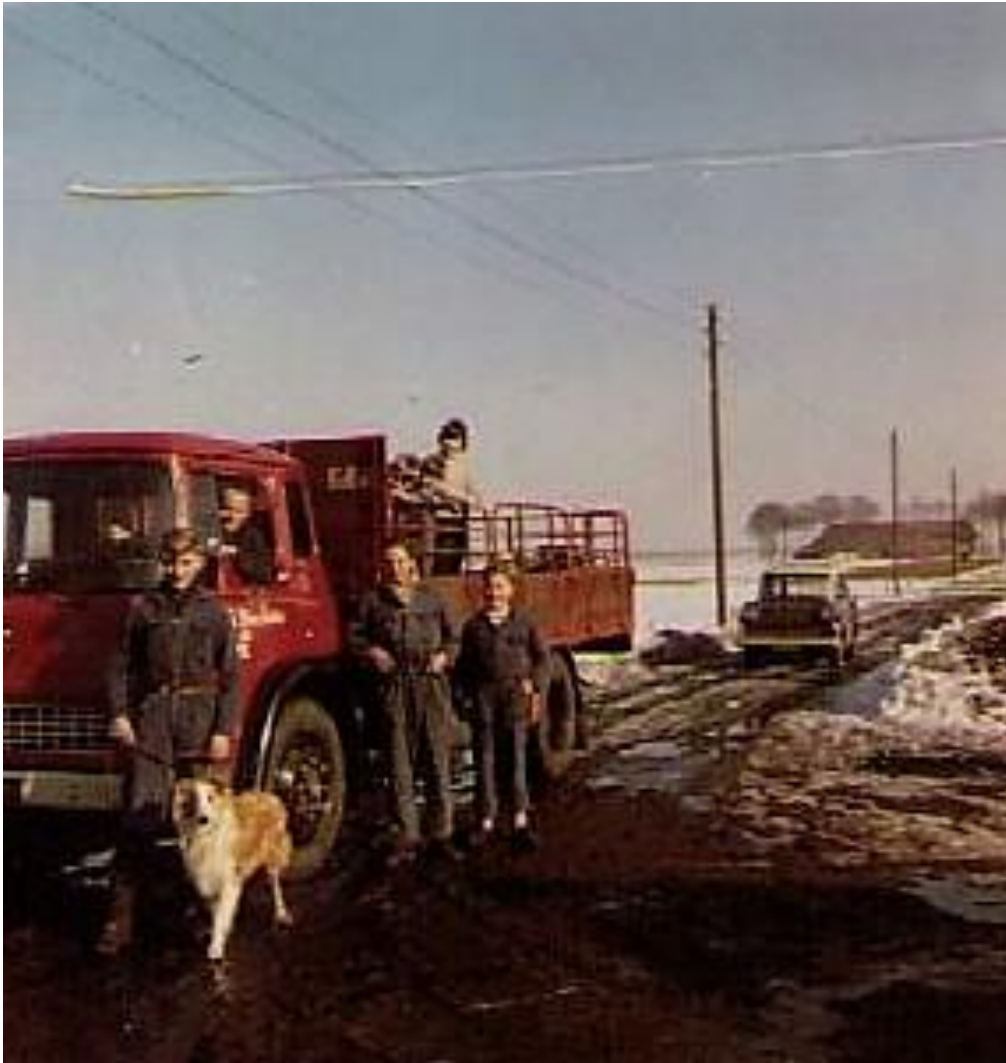
▲ Foto uit 1963 v.l.n.r.: Tiny; Toon Beckers chauffeur; Tien Peeters; Frans; twee kinderen op de laadbak.

Onderhoud aan de vrachtauto's gebeurde tot 2000 in eigen beheer en na die tijd met onderhoudscontracten. Tiny Beckers stopte in 2010 op 63-jarige leeftijd. Broer Antoon wilde nog een paar jaar door gaan, maar kreeg een goed aanbod om te gaan chauffeurs voor Jos van Deurzen en is toen ook gestopt. De bedrijfsvoering verliep in deze tijd erg stroef. Ook was er in de familie geen bedrijfsopvolger. Daarom besloot de familie, ook om mogelijke problemen te voorkomen, dat het een goed tijdstip was om te stoppen en alles te verkopen. Ook het woonhuis en garage Blaarpeelweg 4 is per 1-4-2015 verkocht aan autobedrijf Knijnenburg. Albert Knijnenburg vernieuwde en verbouwde het geheel in 2019 en ging er zelf wonen.