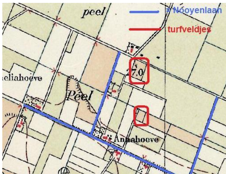
De ontginning families v.d.Ven en v.d.Broek hebben voor eigen gebruik nog turf gestoken in de jaren '30 en '40. De turf werd gestoken op nog niet ontgonnen grond. "Spiergat" of "Moergat" werd dit stuk door hen genoemd.