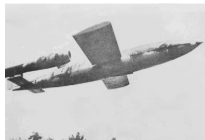
7) Een V1 (vliegende bom) is in de 2 e W.O terecht gekomen tussen de boerderijen van H.v.d.Broek en P.Willems noordwestelijk van de Burg. Nooijenlaan. De luchtdruk veroorzaakte veel schade aan de omliggende boerderijen. De mantel van de V1 deed nog vele jaren dienst als duiker in een veldsloot van de Fam. v.d. Broek