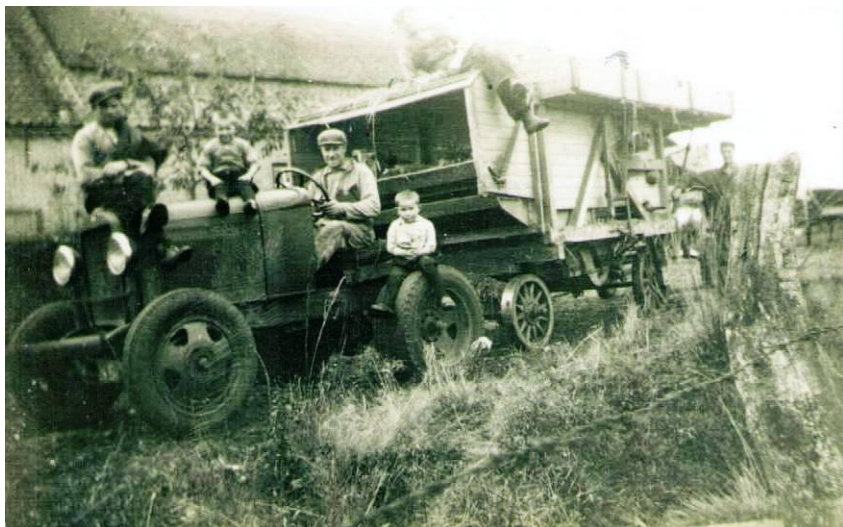
6) Rond 1933-34 begon de Fa. Ploegmakers met dorswerkzaamheden d.m.v. dorskast, paard en stationaire motor. Dit was de basis voor mechanisatie in de landbouw die de werkzaamheden onder de boeren aanmerkelijk verlichtte. Dit bedrijf uitgebouwd tot het huidige bedrijf.