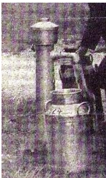
8) Begin jaren zestig was er nog geen waterleiding in de Burg. Nooijenlaan. Iedereen was op de eigen pomp aangewezen. De gemeente noemde het een super-onrendabel gebied. Wel werd er een tappunt aan het begin van de laan geplaatst. Hier kon men in tuiten of tonnen drinkwater voor eigen gebruik halen.